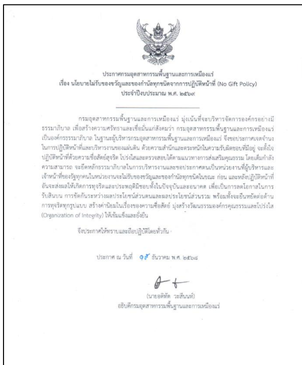
ประกาศเจตนารมณ์ No Gift Policy (ฉบับภาษาไทย)

กรมอุตสาหกรรมพื้นฐานและการเหมืองแร่ ได้ประกาศเจตนารมณ์ No Gift Policy จากการปฏิบัติหน้าที่ ประจำปีงบประมาณ พ.ศ. ๒๕๖๙ เมื่อวันที่ ๑๕ ธันวาคม ๒๕๖๘ (ฉบับภาษาไทย และภาษาอังกฤษ) โดยประกาศตนเป็นหน่วยงานที่ผู้บริหารและเจ้าหน้าที่ของรัฐทุกคนในหน่วยงานจะไม่รับของขวัญและของกำนัลทุกชนิดในขณะที่ ก่อน และหลังปฏิบัติหน้าที่ อันจะส่งผลให้เกิดการทุจริตและประพฤติมิชอบทั้งในปัจจุบันและอนาคต เพื่อเป็นการลดโอกาสในการรับสินบน การขัดกันระหว่างผลประโยชน์ส่วนตนและผลประโยชน์ส่วนรวม พร้อมทั้งจะยึดมั่นต่อต้านการทุจริตทุกรูปแบบ สร้างค่านิยมในเรื่องของความซื่อสัตย์ มุ่งสร้างวัฒนธรรมองค์กรคุณธรรมและโปร่งใส (Organization of Integrity) ให้เข้มแข็งและยั่งยืน โดยมีผู้บริหารสูงสุดของหน่วยงานลงนามในประกาศ และแจ้งให้บุคลากรได้รับทราบและถือปฏิบัติโดยทั่วกัน